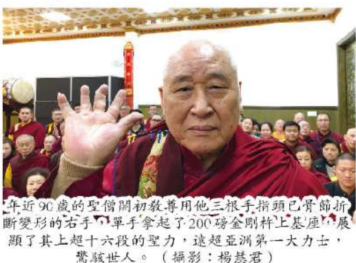
年近90歲的聖僧開初教尊用他三根手指頭已骨節折斷變形的右手，單手拿起了200磅金剛杵上基座，展現了其上超十六段的聖力，遠超亞洲第一大力士，驚駭世人。