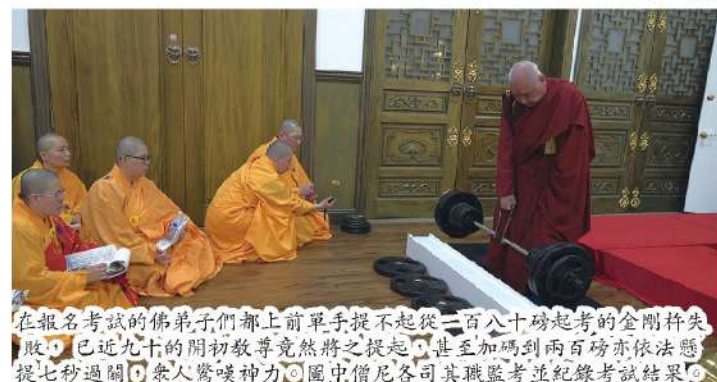
在報名考試的佛弟子們都上前單手提不起從一百八十磅起考的金剛杵失敗，已近九旬的開初教尊竟然將之提起，甚至加碼到兩百磅亦依法懸提七秒過關，眾人驚嘆神力。圖中僧尼各司其職監考並紀錄考試結果。