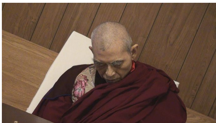
禄东赞法王生死自由，在预告的时间圆寂