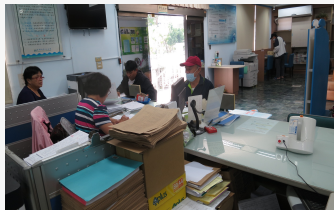
接用自來水現在申請省很大