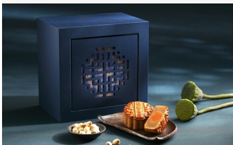
寒舍集團【丹桂·澄月】中秋月餅禮盒開始預購8/19前享85折